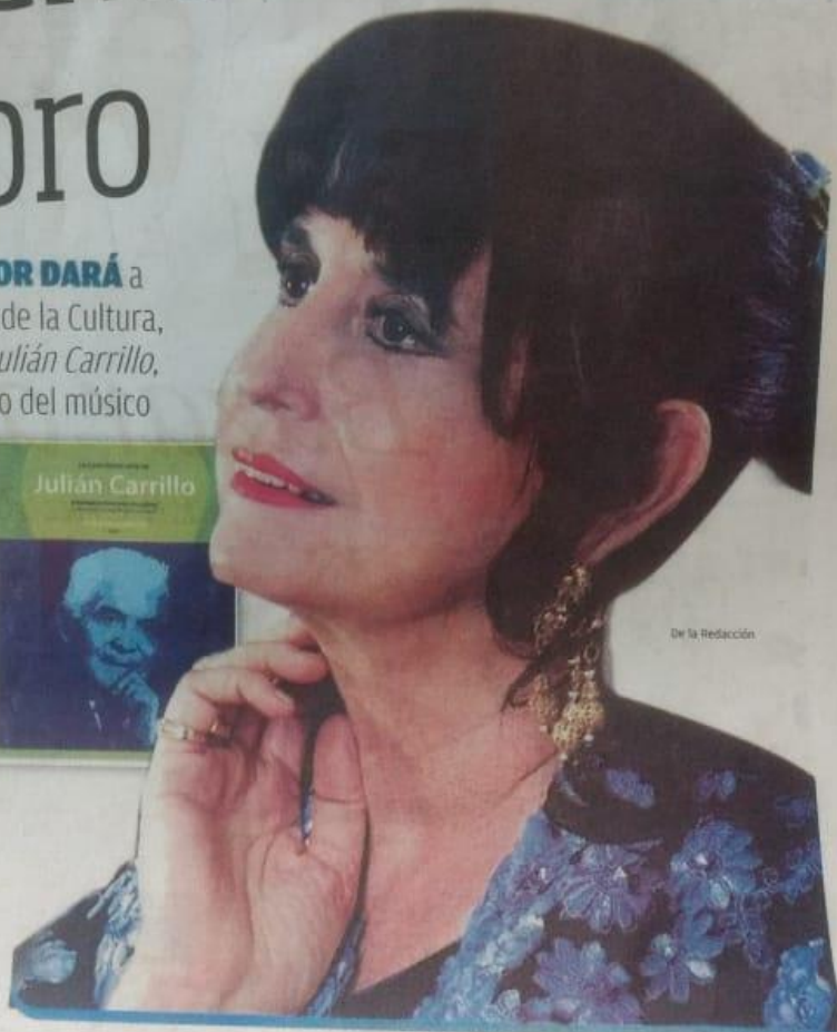
De la Redacción